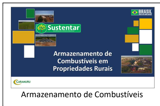
Armazenamento de Combustíveis