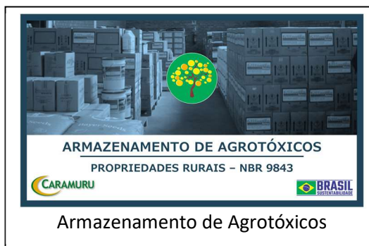
Armazenamento de Agrotóxicos

Os temas dos treinamentos e das palestras são definidos de acordo com a necessidade dos agricultores, da necessidade de adequação legal e por iniciativa da Caramuru de acordo com sua visão de mercado.